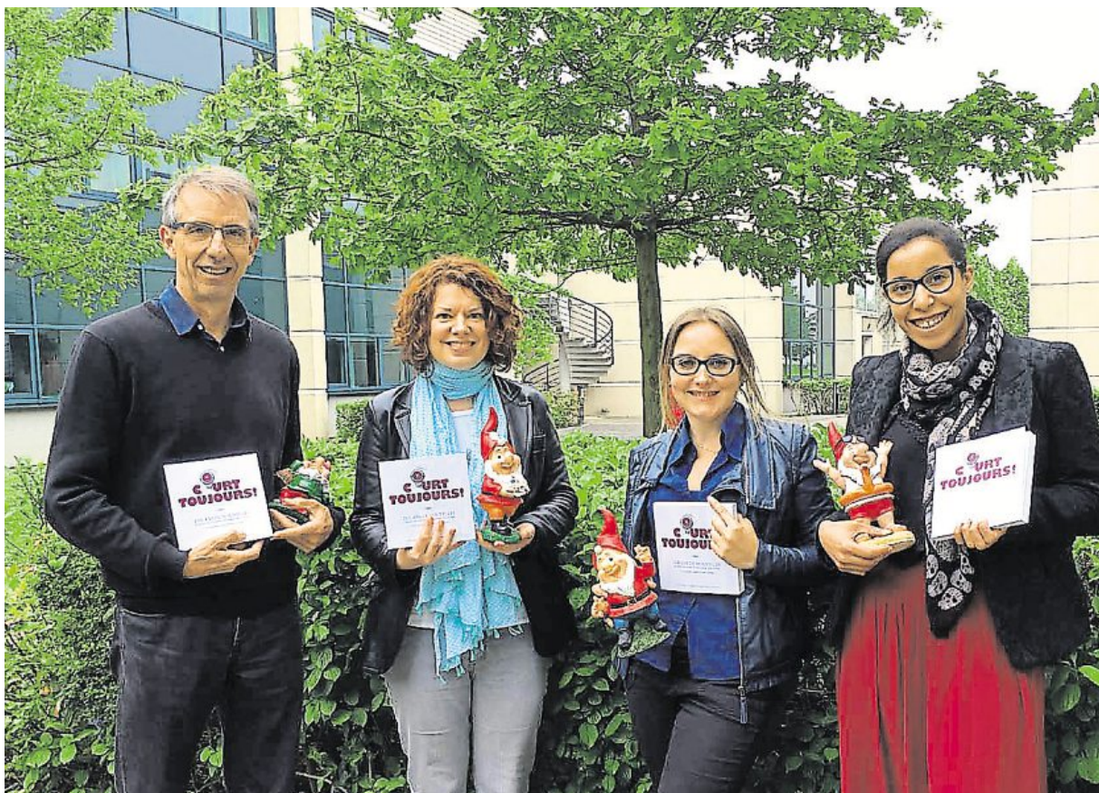
L'équipe du Centre régional des lettres tient bien en main « Court toujours », le recueil de toutes les nouvelles lauréates des concours des dix dernières années.

Une journée dense « Ce mardi s'annonce festif, lettré bien sûr, mais aussi fleuri ! » Ce matin, en effet, une classe d'Équeurdreville va rencontrer l'auteur de renom Timothée de Fombelle. À 13 h 30, au Café des images, une projection ouverte au public est prévue. « Il s'agit de Tante Hilda, une fable écologique animée en lien avec le thème de cette année. » À 15 h, toujours au Café des images, aura lieu la très attendue remise des trois différents prix du concours lycéen qui verra l'auteur de la meilleure nouvelle empocher la somme de 200 €.