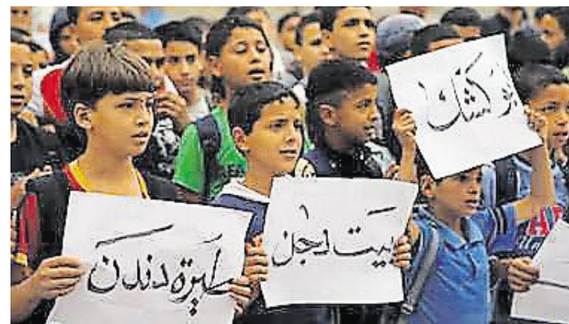
Ce mardi, au Lux, soirée-débat autour du documentaire réalisé par Tamara Erde.

Le Collectif Palestine 14, en partenariat avec le cinéma Lux, organise une soirée-débat avec comme thème « L'éducation peut-elle abattre les murs ? ». En ouverture de cette soirée, sera projeté This is my land , documentaire de Tamara Erde, présente ensuite pour le débat. Ce documentaire observe la manière dont on enseigne l'histoire dans les écoles (publiques ou religieuses) d'Israël et de Palestine. Ce film, à travers des portraits d'enseignants et des rencontres avec les enfants, révèle les murs que l'on