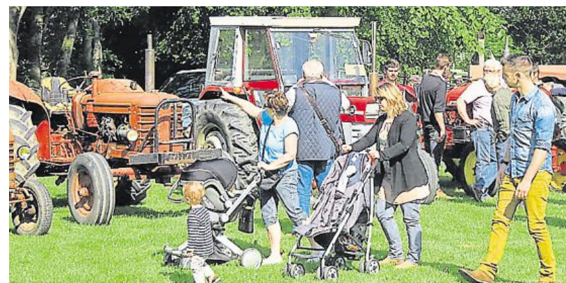
La 17 e édition de Bœuf en fête se déroulera dimanche, à Maltot.

Dimanche, le château de Maltot accueillera la 17 e édition de la manifestation Bœuf en fête. Avec le Finistère comme invité d'honneur, Bœuf en fête promet encore de belles animations. Cette année, la limousine sera mise en avant et la chambre de l'agriculture présentera les grandes filières agricoles régionales. Cette 17 e édition s'appuie sur des animations identiques comme l'atelier culinaire animé par les Toques normandes, la ferme normande, le marché du terroir, l'exposition de ma-