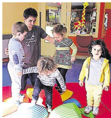
Les enfants de la Baminerie bénéficient désormais d'ateliers d'éveil corporel et de motricité, une fois par mois.