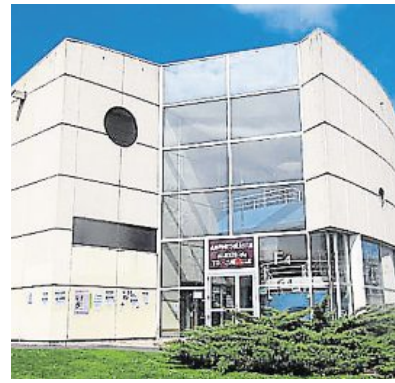
L'assemblée générale de luttes est installée dans l'amphi Tocqueville, sur le campus 1, depuis lundi.

Lundi, vers 19 h, des militants contre la loi Travail ont investi l'amphi