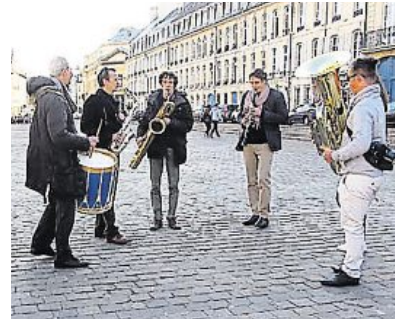
En fin d'après-midi, des musiciens ont joué sur la place Saint-Sauveur, pour alerter le public.

une symphonie jouée seulement par les effectifs du corps professoral, le concert d'hier soir a été modifié.