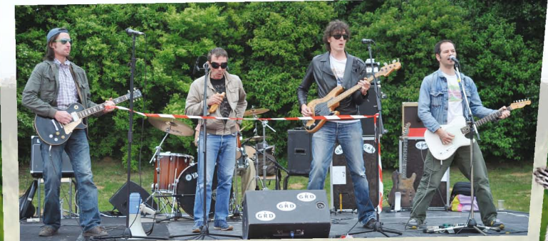
Les producteurs de Porc, c'est grock'n'roll.