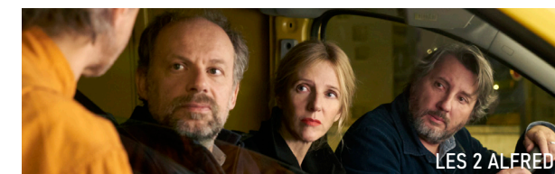
LES 2 ALFRED