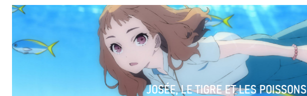
JOSÉE, LE TIGRE ET LES POISSONS

CINÉMA LUX | AVENUE SAINTE-THÉRÈSE | CAEN