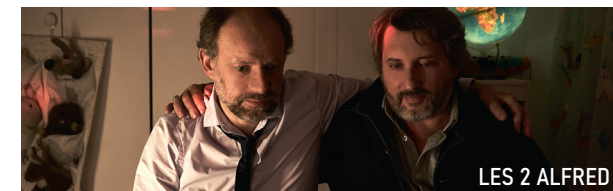
LES 2 ALFRED