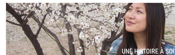
UNE HISTOIRE A SOI

CINÉMA LUX | AVENUE SAINTE-THÉRÈSE | CAEN