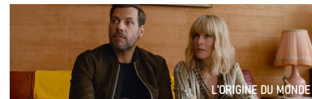
L'ORIGINE DU MONDE