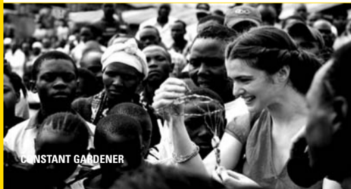
THE CONSTANT GARDENER

DE VITTORIO DE SICA, ITALIEN-ALLEMAND, 1970-1H34.