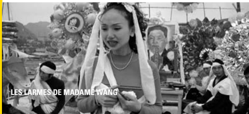
LES LARMES DE MADAME WANG

Artiste au chômage, Madame Wang, vend des CD et DVD au marché noir. Mais elle doit quitter Pékin, lorsque son mari est arrêté afin de renflouer ses dettes de jeu. Accompagnée d'une enfant abandonnée, elle retourne dans sa ville natale située dans la province de Guizhou. Elle demande alors de l'aide à son ancien petit ami, Youming, qui lui conseille de devenir pleureuse professionnelle lors des cérémonies funéraires. Après un mauvais départ, elle devient bientôt la pleureuse la plus populaire de la région. Au travers d'un portrait touchant de femme, le film s'interroge aussi sur la place de la Femme dans la Chine d'aujourd'hui.