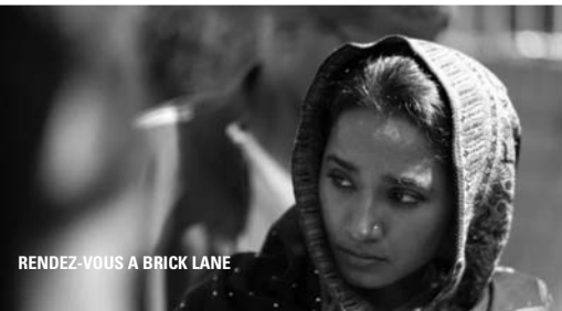
RENDEZ-VOUS A BRICK LANE

Née au Bangladesh, la jeune Nazneen, promise à un homme plus âgé, a quitté sa famille et son pays pour rejoindre son futur époux à Londres. Isolée dans un pays dont elle parle à peine la langue, elle se consacre à sa famille dans la cité de Brick Lane où règnent racisme ordinaire, fondamentalisme rampant et trafics en tous genres. Petit à petit, elle découvre pourtant la solidarité et l'amitié. Tiraillée entre traditions ancestrales et espoirs insensés, Nazneen va peu à peu prendre le contrôle de sa vie, jusqu'à franchir le pire des interdits... Et comprendre que s'octroyer le droit au bonheur a un prix. Porté par des acteurs impressionnants de justesse "Brick Lane" évoque les difficultés d'intégration.