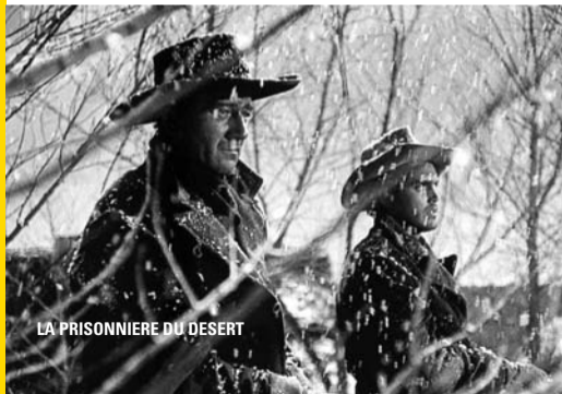
LA PRISONNIÈRE DU DÉSERT

A suivre jusque fin mai : Frontières chinoises, Les 2 cavaliers, Les cavaliers, Les cheyennes, Patrouille perdue, Mogambo, Le sergent noir, L'homme qui tua Liberty Valance