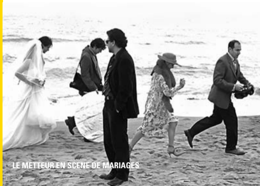
LE METTEUR EN SCÈNE DE MARIAGES