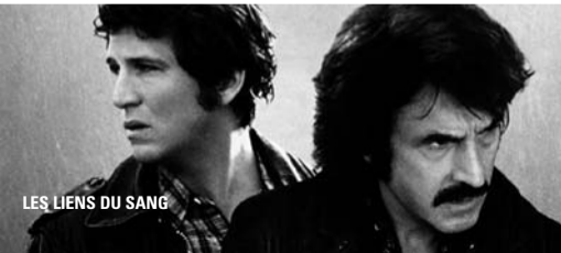
LES LIENS DU SANG

Lyon, à la fin des années 70. François, inspecteur de police, apprend la sortie de prison de son frère, Gabriel, qui vient de tirer dix ans pour meurtre. Entre le flic et son aîné, les retrouvailles ne sont pas évidentes, mais chacun a la volonté de tirer un trait sur le passé. Gabriel essaie de se ranger et François se met en quatre pour l'aider. Mais la réalité et les vieux démons finissent par les rattraper... «Cette fiction inspirée de faits authentiques a le souffle d'une épopée, lumineuse et tragique.» (Elle)