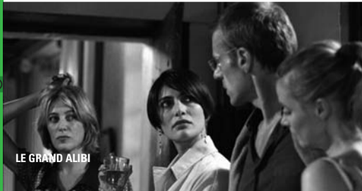
LE GRAND ALIBI

Un temps pour se rencontrer et échanger, autour du film L'Heure d'été et d'une collation.