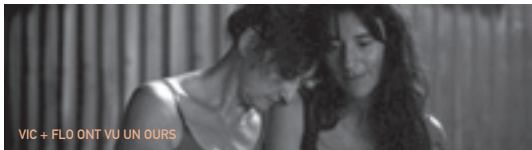
VIC + FLO ONT VU UN OURS

La Trilogie vous est proposée en deux volumes : volume 1 : My Childhood & My Ain Folk ; volume 2 : My Way Home .