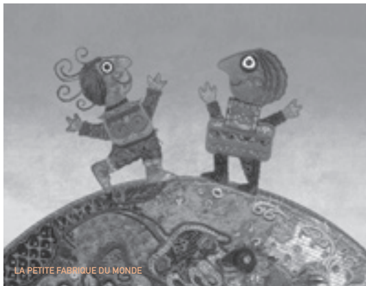
LA PETITE FABRIQUE DU MONDE

Films de Billy Wilder disponibles à la location au Vidéoclub du Cinéma LUX : Boulevard du crépuscule, Certains l'aiment chaud, La Garçonnière, Irma la douce.