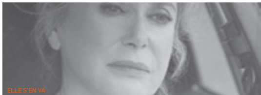
ELLE S'EN VA

🎞 Films de Billy Wilder disponibles à la location au Vidéoclub du Cinéma LUX : Boulevard du crépuscule, Certains l'aiment chaud, La Garçonnière, Irma la douce.