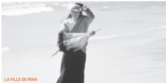
LA FILLE DE RYAN