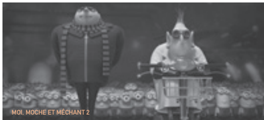
MOI, MOCHE ET MÉCHANT 2