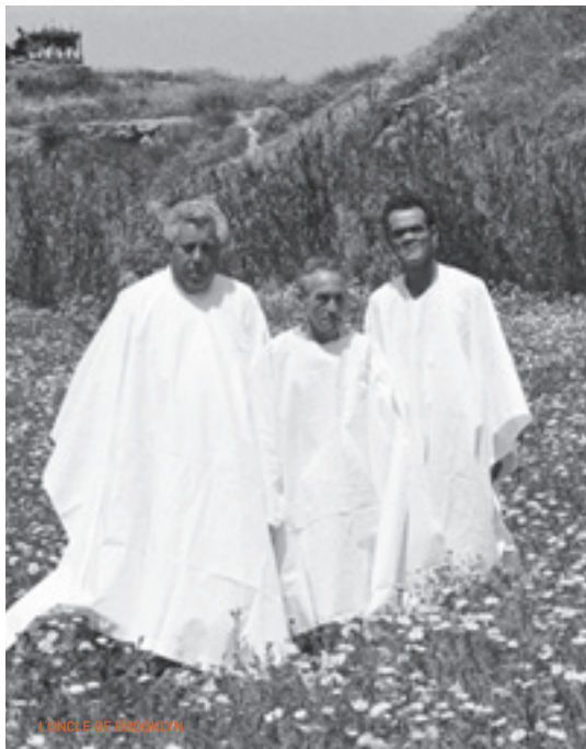
L'ONCLE DE BROOKLYN

La famille Gemelly se voit contrainte par la mafia locale d'héberger pendant quelques temps «l'oncle de Brooklyn», personnage mystérieux venu d'on ne sait où. Mais les jours passent sans que personne ne vienne chercher cet oncle qui ne mange pas, ne dort pas et ne parle pas... Dans la veine de Pasolini et Buñuel, avec cet humour empreint d'une dimension tragique et métaphysique, L'Oncle de Brooklyn est l'un des grands films italiens des années 1990. Interdit de sortie en Italie mais présenté au Festival de Berlin, le film reste encore aujourd'hui magnifiquement irrévérencieux, parfois drôle et toujours aux limites de la folie. «Barge, irrévérencieux, très drôle et parfois volontairement exaspérant, L'Oncle de Brooklyn témoigne d'un plaisir immédiat, celui de fabriquer un cinéma en toute liberté, loin des sentiers battus.» (aVoir-aLire.com)