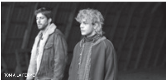
TOM À LA FERME

Un jeune publicitaire voyage jusqu'au fin fond de la campagne pour des funérailles et constate que personne n'y connaît son nom ni la nature de sa relation avec le défunt. Lorsque le frère aîné de celui-ci lui impose un jeu de rôles malsain visant à protéger sa mère et l'honneur de leur famille, une relation toxique s'amorce bientôt pour ne s'arrêter que lorsque la vérité éclatera enfin, quelles qu'en soient les conséquences. Après J'ai tué ma mère , Les Amours imaginaires et Laurence Anyways , sorte de trilogie sur le thème de l'amour impossible, Xavier Dolan signe un thriller psychologique du meilleur cru adapté d'une pièce de théâtre de l'auteur québécois Michel Marc Bouchard. Thriller aux accents hitchcockiens, le film multiplie les citations au maître et, comme chez Hitchcock, le film fonctionne comme un piège qui se referme inexorablement à la fois sur le héros et sur le spectateur. La musique de Gabriel Yared, à la manière de Bernard Herrmann, renforce cette impression de cousinage prestigieux. Derrière le film à suspense se cache cependant un autre film, extrêmement subtil, sur le deuil amoureux et l'amour entre trois individus. L'amour, mais aussi la violence et la folie, ne sont jamais loin.