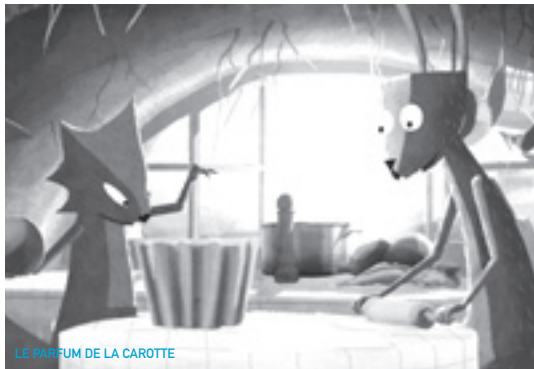
LE PARFUM DE LA CAROTTE

Troisième grand comique du cinéma muet américain avec Charlie Chaplin et Buster Keaton, Harold Lloyd est resté célèbre comme «l'homme aux lunettes d'écaïlle». Dans ce nouveau programme de 4 courts-métrages, il campe un personnage de jeune amoureux un peu gauche en prise à des situations plus loufoques les unes que les autres : qu'il soit maître-nageur malgré lui ou prisonnier d'une étrange tribu de femmes pirates, Harold Lloyd se joue de tous les obstacles pour séduire sa belle. Quatre histoires hilarantes et rocambolesques à découvrir pour la première fois en version numérique restaurée !