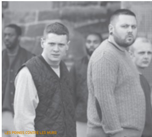
LES POINGS CONTRE LES MURS

Poings Contre Les Murs a beau s'inscrire dans un genre (le film de prison) qui est vendu avec sa panoplie de passages obligés (antagonismes entre détenus, prises de pouvoir, gardes vicieux, scènes de cantine, cachot, etc), il n'a pas son pareil pour plonger le spectateur dans l'enfer réaliste des pénitenciers anglais. La violence du film frôle parfois le génie dans la façon d'orchestrer son explosion. La mise en scène est comme une cocotte minute qui accumule la pression à plusieurs reprises après des éclats qui font avancer le récit. Le réalisateur parvient à maintenir le cap d'une histoire touchante, presque animale, d'apprivoisement vers la rédemption.