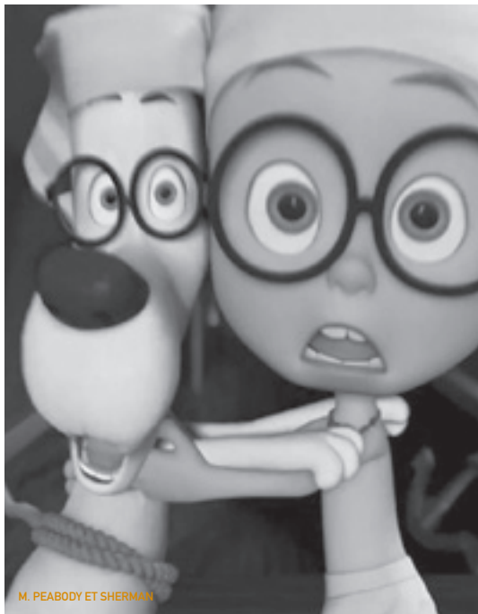
M. PEABODY ET SHERMAN

M. Peabody est la personne la plus intelligente au monde. Il est à la fois lauréat du prix Nobel, champion olympique, grand chef cuisinier... et il se trouve aussi être un chien ! Bien qu'il soit un génie dans tous les domaines, M. Peabody est sur le point de relever son plus grand défi : être père. Pour aider Sherman, son petit garçon adoptif, à se préparer pour l'école, il décide de lui apprendre l'histoire et construit alors une machine à voyager dans le temps. Les choses commencent à mal tourner quand Sherman enfreint les règles et perd accidentellement dans le temps Penny, sa camarade de classe. «Avec les voyages mouvementés d'un chien surdoué et de son fils adoptif, Rob Minkoff livre une relecture express de l'Histoire : une comédie sympathique et familiale !» (Les Fiches du Cinéma)