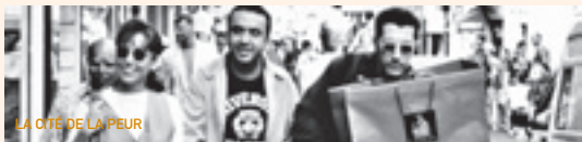
LA CITÉ DE LA PEUR

La nuit du 24 au 25 août 1944. Le sort de Paris est entre les mains du Général Von Choltitz, Gouverneur du Grand Paris, qui se prépare, sur ordre d’Hitler, à faire sauter la capitale. Utilisant toutes les armes de la diplomatie, le consul suédois Nordling va essayer de convaincre le général de ne pas exécuter l’ordre de destruction. S’inspirant de la pièce de théâtre éponyme de Cyril Gély, Volker Schlöndorff puise dans les événements historiques pour tisser un duel psychologique entre les deux protagonistes incarnés à l’écran comme sur les planches par deux acteurs au sommet.