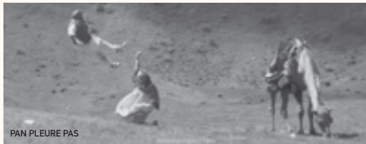
PAN PLEURE PAS

Rencontre avec le réalisateur Gabriel Abrantes à l'issue de la projection de son film Pan pleure pas.