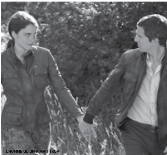
L'HOMME QU'ON AIMAIT TROP

«Célèbre pour avoir tourné le premier film événement sur la Résistance ( La Bataille du rail ), René Clément reprend ici un thème proche, avec la même rigueur documentaire assortie d'un humanisme délicat et tragiquement féérique. Il épingle sans pitié la hargne clanique de familles paysannes qui se jalouent et défendent leurs petits intérêts. Bien avant Charles Laughton et sa légendaire Nuit du chasseur , il s'immisce aussi dans l'imaginaire morbide et franc de l'enfance, avec son lot d'images oniriques lourdes en symboles (...) Bouleversante, Brigitte Fossey nous tire des larmes à chacune de ses apparitions.» (Télérama)