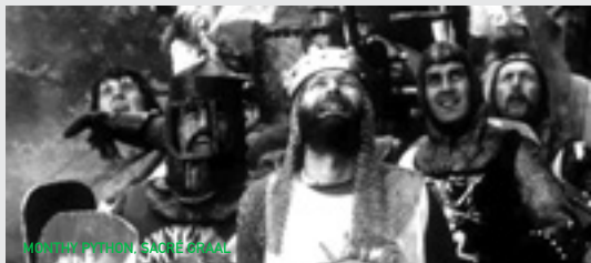
MONTY PYTHON, SACRÉ GRAAL