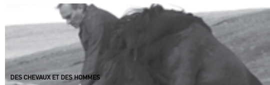
DES CHEVAUX ET DES HOMMES

Ce film vous est présenté en collaboration avec L'Elan des Jeux à l'occasion des Jeux Equestres Mondiaux FEI AlltechTM 2014.