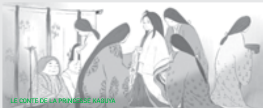
LE CONTE DE LA PRINCESSE KAGUYA