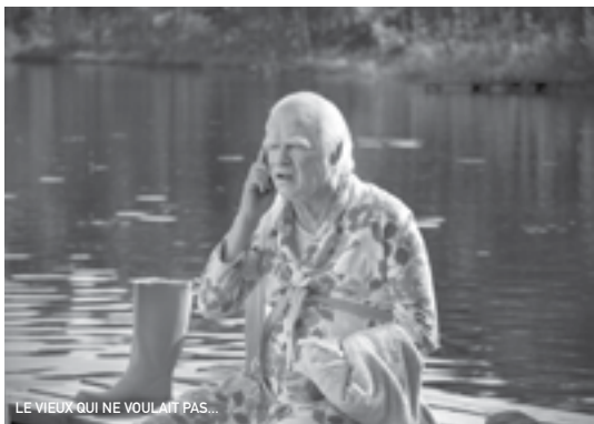
LE VIEUX QUI NE VOULAIT PAS...

Le jour de son 100ème anniversaire, un homme s'échappe de sa maison de retraite pour une cavale rocambolique, certain qu'il n'est pas trop tard pour tout recommencer à zéro. Débute alors une aventure inattendue et hilarante aux côtés d'un escroc, d'un vendeur de hot-dogs, d'une rousse et d'un éléphant... Adapté du roman de Jonas Jonasson, version suédoise de Forrest Gump croisée avec l'irrévérence des Monty Python, Le Vieux... est un régal d'humour noir, un road-movie déjanté à voir avec gourmandise.