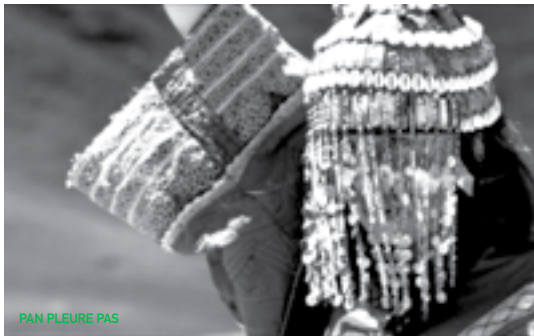
PAN PLEURE PAS

Trois folles histoires qui jouent avec les tabous contemporains et abordent les thèmes fétiches d'Abrantes : les rapports de force politiques, économiques, culturels, sexuels et sentimentaux entre le Nord et le Sud. Dans Liberdade , un jeune homme souffrant d'impuissance sexuelle est bien décidé à braquer une pharmacie pour obtenir du Viagra. Dans Taprobana , au XVIe siècle, le célèbre Camões batifole sous opium dans la jungle indienne en attendant que les autorités portugaises lui mettent la main dessus. Dans Ennui ennui , en Afghanistan, Cléo, représentante de Bibliothèques sans Frontières, est kidnappée par un seigneur de guerre empoté contraint par sa mère à violer une jeune vierge... Complètement déjanté et délibérément provocateur !