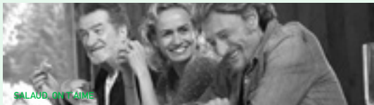
SALAUD, ON T'AIME