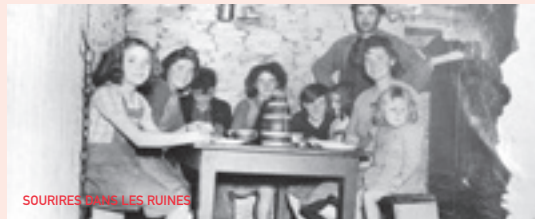
SOURIRES DANS LES RUINES

Pour le détail sur les films, voir les pages « A l'affiche » et les grilles horaires pour les jours et heures de passage.