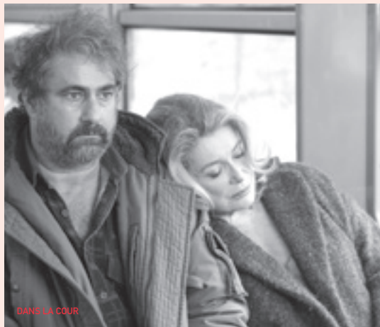
DANS LA COUR

Tarifs : 4,20 € (collation offerte) ; 3,20 € pour les groupes