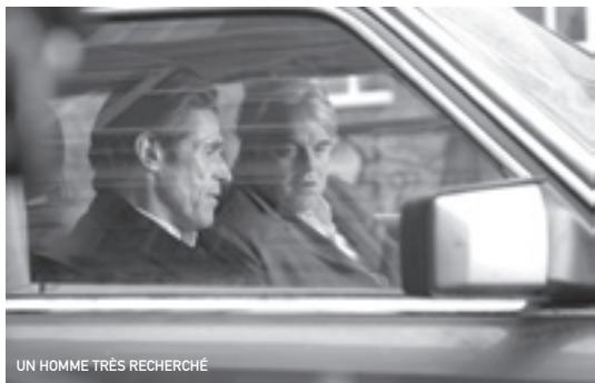
UN HOMME TRÈS RECHERCHÉ

Film de Nuri Bilge Ceylan disponible au Vidéoclub : Uzak.