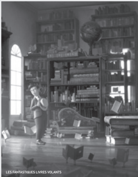
LES FANTASTIQUES LIVRES VOLANTS

Aurore Bosquet - 02 31 82 29 87 - aureore@cinemalux.org