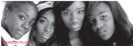
BANDE DE FILLES

La joyeuse petite taupe qu'on aime tous revient pour cinq épisodes inédits au cinéma. Sa curiosité et sa malice l'entraînent une nouvelle fois dans des aventures burlesques et attendrissantes qui feront le bonheur des plus petits spectateurs ! Au programme : « La Petite Taupe et le parapluie », « La Petite Taupe jardinier », « La Petite Taupe et le carnaval », « La Petite Taupe et la sucette », « Le Noël de La Petite Taupe ».