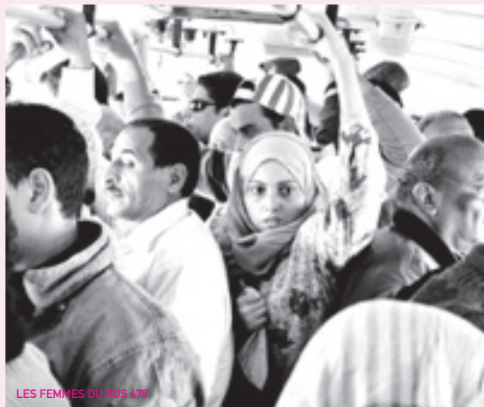
LES FEMMES DU BUS 478

Samedi 13 décembre : Rencontre avec l'équipe du film à l'issue de la projection en avant première de Discount .