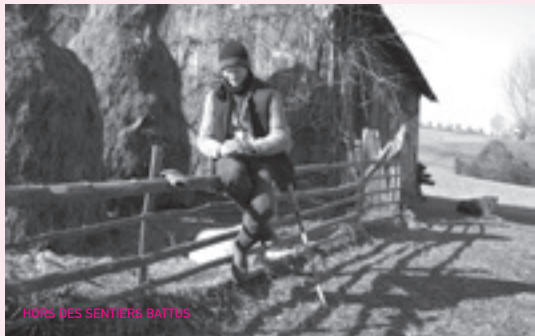
HORS DES SENTIERS BATTUS

Tarifs : soirée 8€ ou tarifs habituels film/film.