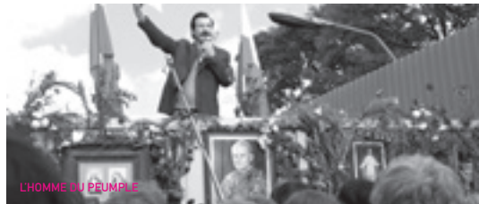
L'HOMME DU PEUPLE