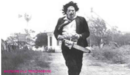
MASSACRE À LA TRONÇONNEUSE