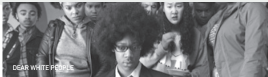
DEAR WHITE PEOPLE

Prix Marcello Mastroianni du meilleur jeune espoir Mostra de Venise 2014