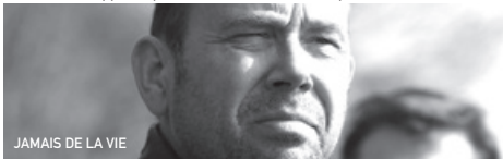
JAMAIS DE LA VIE

A l'heure du départ pour la grande migration, Darius, le doyen de la volée est blessé, il va devoir confier tous ses secrets et le nouvel itinéraire du voyage au premier oiseau venu. Et cet oiseau... c'est notre héros, exalté à l'idée de découvrir enfin le monde... mais pas du tout migrateur ! Pensez donc : Gus, petit oiseau jaune a été élevé par une coccinelle ! Un vrai défi pour Gus, drôle de loustic qui n'a pas beaucoup de kilomètres à son compteur ! «Stylisée, colorée, d'une réelle drôlerie, cette comédie initiatique très animée rappelle qu'à cœur vaillant, rien d'impossible.» (Télérama)