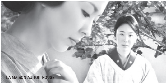
LA MAISON AU TOIT ROUGE

Un petit génie de la robotique nommé Hiro Hamada découvre qu'un complot criminel menace de détruire la ville de San Fransokyo. Avec l'aide de son plus proche ami, Baymax le robot infirmier, et de ses compagnons qu'il va transformer en une bande de superhéros high-tech, Hiro va tout faire pour sauver la ville et sa population de l'infâme Yokai... Sous influence revendiquée de l'animation nippone, ce premier cartoon Disney inspiré par des personnages de la galaxie Marvel a tout pour plaire : des héros branchés et cool, des scènes de combat, de l'humour pour tous et une arme de séduction massive, le génial Baymax !