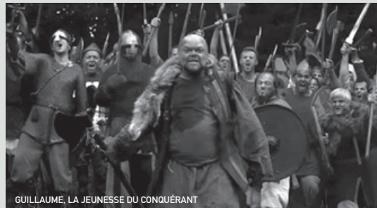
GUILLAUME, LA JEUNESSE DU CONQUÉRANT