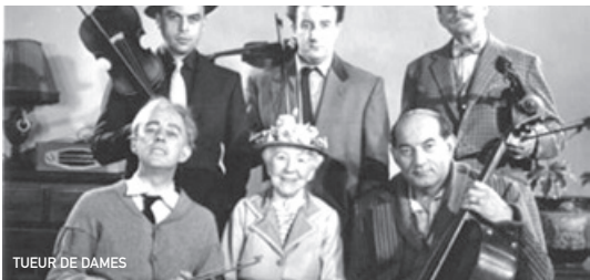
TUEUR DE DAMES

Ce film a reçu le soutien à la réécriture de long métrage de la Région Basse-Normandie en partenariat avec le CNC et en collaboration avec la Maison de l'Image Basse-Normandie. La programmation du film fait écho aux Assises Régionales du Cinéma et de l'Audiovisuel #1 organisées les 2 et 3 avril à l'Esam par la Maison de l'Image et les professionnels sur le thème «Qu'est-ce que le cinéma et l'audiovisuel créent sur nos territoires ?».