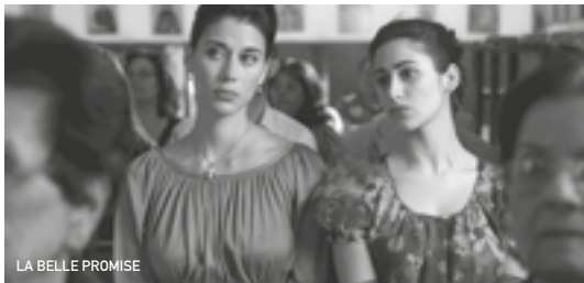
LA BELLE PROMISE

En Palestine, trois sœurs issues de l'aristocratie chrétienne ont perdu leur terre et leur statut social après la guerre des Six Jours de 1967 avec Israël. Incapables de faire face à leur nouvelle réalité, elles s'isolent du reste du monde en s'enfermant dans leur villa pour se raccrocher à leur vie passée. L'arrivée de leur jeune nièce, Badia, ne tarde pas à bousculer leur routine et d'autant plus lorsqu'elles se mettent en tête de lui trouver un mari. «Je voulais mettre en avant la réalité de la vie palestinienne, et montrer que les problèmes en Palestine, tels qu'ils sont montrés aujourd'hui, mettent trop souvent de côté la question de l'humain. Ce n'est pas qu'une question de morts, de territoires ou de martyrs mais plutôt d'êtres humains avec leurs forces et faiblesses, leur compassion ou leur entêtement. J'avais l'impression que cela manquait aux films palestiniens où nous sommes dépeints soit comme héros soit comme victimes, sans jamais parler des êtres en tant que personne. C'est précisément le sens de ma démarche.» Suha Arraf, réalise ici son premier film après avoir été scénariste de La Fiancée syrienne et Les Citronniers .