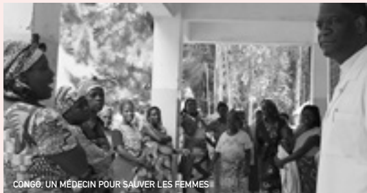
CONGO, UN MÉDECIN POUR SAUVER LES FEMMES