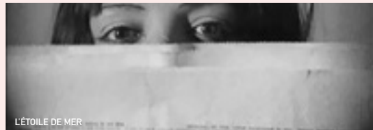
L'ÉTOILE DE MER