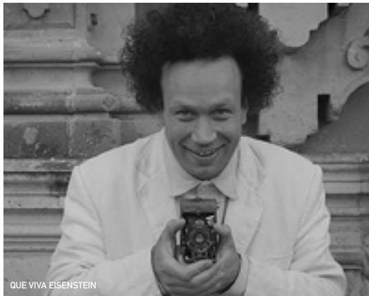
QUE VIVA EISENSTEIN

preuve d'une passion folle pour l'image et le montage. Eisenstein n'est-il pas considéré comme le père de la grammaire cinématographique contemporaine ? De son côté, on réduit souvent Greenaway à un âge d'or remontant aux années 80/90. C'est oublier qu'il continue depuis son travail de recherche picturale dans des projets multimédias, certes souvent inédits chez nous, mais témoignant d'une volonté ludique de trouver une forme toujours renouvelée de faire du cinéma. Il fallait bien un auteur aussi inventif visuellement pour tenter de rendre hommage au maître russe. La richesse visuelle de Que Viva Eisenstein! ne surprendra peut-être pas les habitués du cinéaste (qui est cette fois un peu plus sage que dans le foisonnant The Tulse Luper Suitcases , par exemple), mais cueillera ceux qui, on l'espère, le redécouvriront.