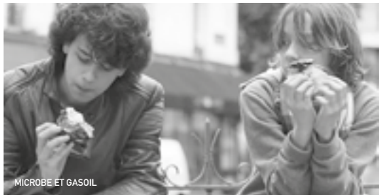
MICROBE ET GASOIL

Les aventures débridées de deux ados un peu à la marge : le petit «Microbe» et l'inventif «Gasoil». Alors que les grandes vacances approchent, les deux amis n'ont aucune envie de passer deux mois avec leur famille. A l'aide d'un moteur de tondeuse et de planches de bois, ils décident donc de fabriquer leur propre «voiture» et de partir à l'aventure sur les routes de France... Microbe et Gasoil est l'histoire de ce road-trip bancal mais surtout celle de l'amitié fulgurante entre ces deux ados. Le cinéaste bricoleur et poétique signe là son onzième film. Après la machine à remonter le temps d'une seconde ( La Science des rêves ), le remake de film fait maison ( Soyez sympas, rembobinez ) et le piano cocktail ( L'Écume des jours ), Michel Gondry nous présente donc un nouvel objet "do it yourself". Une sorte de voiture-maison, grâce à laquelle les deux enfants voyagent et dans laquelle ils peuvent se réfugier. Le film, inspiré de souvenirs personnels du réalisateur, se pose la question du passage à l'âge adulte. Embarquez vite avec les deux jeunes formidables comédiens découverts par Michel Gondry !