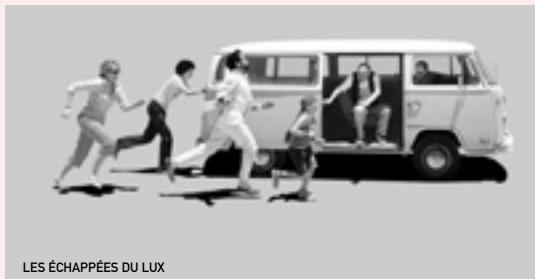
LES ÉCHAPPÉES DU LUX

Attention, le nombre de places est limité ! Réservations indispensables !