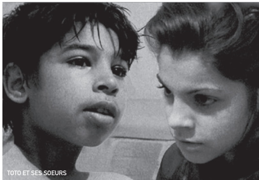
TOTO ET SES SOEURS

Hiver 1982 au cœur de l'Antarctique. Une équipe de chercheurs composée de 12 hommes, découvre un corps enfoui sous la neige depuis plus de 100 000 ans. Décongelée, la créature retourne à la vie en prenant la forme de celui qu'elle veut ; dès lors, le soupçon s'installe entre les hommes de l'équipe. Où se cache la créature ? Qui habite-t-elle ? Un véritable combat s'engage. «Carpenter s'en donne à cœur joie dès qu'il s'agit de filmer les couloirs souterrains de la station, les paysages glacés, la nuit, le froid, la tension au sein du groupe : à bien des égards, il réalise là son film le plus abouti, le plus maîtrisé.» (Cahiers du cinéma)