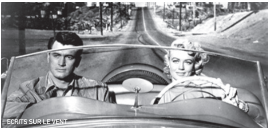
ECRITS SUR LE VENT

Ce film est soutenu par le Groupement National des Cinémas de Recherche (GNCR)