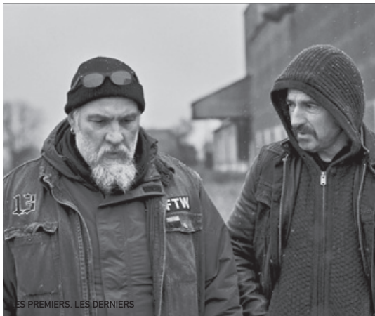
LES PREMIERS, LES DERNIERS

Dans une galaxie lointaine, très lointaine, un nouvel épisode de la saga, 30 ans après les événements du Retour du Jedi. «Attendu au tournant, J.J. Abrams signe une synthèse parfaite entre l'héritage de la saga et la nécessité de l'adapter au XXI e siècle et de séduire de nouveaux (et jeunes) spectateurs. Nul autre cinéaste que lui ne pouvait faire de ce 7 e épisode un film d'une aisance si altière et d'une fluidité si malicieuse.» (Cahiers du Cinéma)