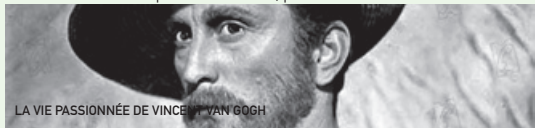
LA VIE PASSIONNÉE DE VINCENT VAN GOGH

A Londres, en 1866, Basil Hallward peint le portrait d'un séduisant jeune homme, Dorian Gray. Ce dernier s'amourache d'une chanteuse de cabaret, mais les conventions rigides de son milieu le font rompre et elle se suicide. En rentrant chez lui, il trouve que son portrait a une expression plus dure, presque cruelle. Meilleure adaptation du roman d'Oscar Wilde, ce film hollywoodien est typique du raffinement esthétique d'Albert Lewin, petit maître du cinéma américain.