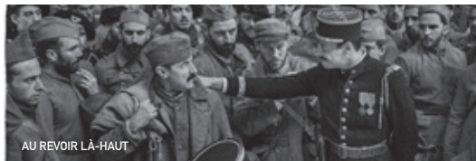
AU REVOIR LÀ-HAUT