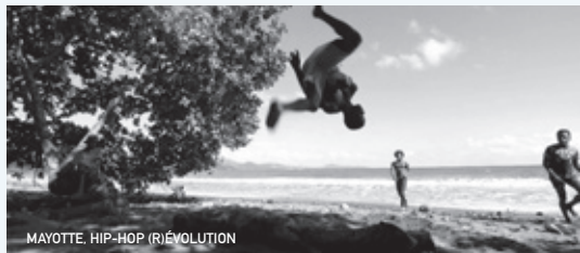
MAYOTTE. HIP-HOP (R)ÉVOLUTION

Tarifs habituels (pensez à réserver vos places sur www.cinematlux.org ou à la caisse du cinéma).