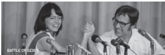
BATTLE OF SEXES