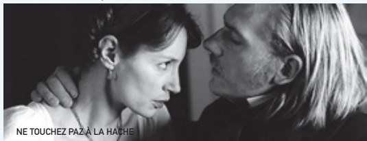
NE TOUCHEZ PAS LA HACHE

Tarifs habituels (pensez à réserver vos places sur www.cinematlux.org ou à la caisse du cinéma).