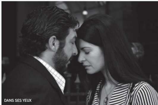
DANS SES YEUX

Dans ses yeux mène avec brio les deux histoires en parallèle. Le spectateur se laisse envoûter par cette histoire d'amour, de vengeance et de justice : notions humaines, donc imparfaites... Du grand cinéma, récompensé par l'oscar du meilleur film étranger.