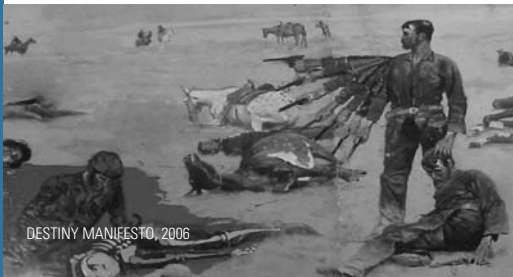
DESTINY MANIFESTO, 2006

Programme : 08 92 68 00 29 / http://cinemasirius.canalblog.com