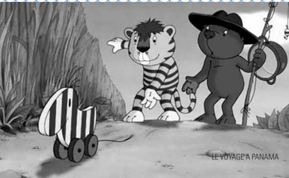
LE VOYAGE À PANAMA